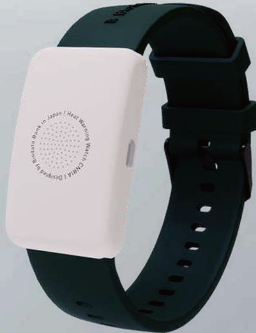
熱中症予防ウェアラブルデバイス