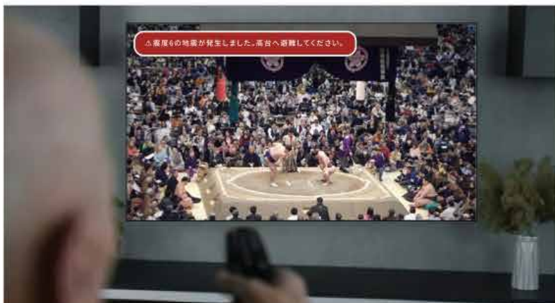
*利用イメージ(TV視聴中のプッシュ通知：大相撲の中継途中に地震による避難連絡が表示)

視聴している放送(地デジ・BS・CS)やビデオ・ネット動画サービスに影響されずTV画面にポップアップ通知、着信通知の表示が可能に。