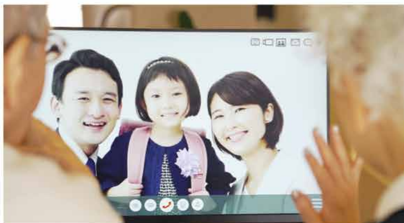
*利用イメージ(テレビ画面を通して、孫とテレビ電話)

このシステムは、テレビ電話のシステムをスマホやタブレットだけではなく、ご自宅のTVに拡大できる技術です。利用者が設定できる4～13桁番号で端末同士を認識することで、端末間同士の応答を可能に。