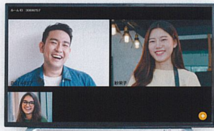
複数人との同時会話