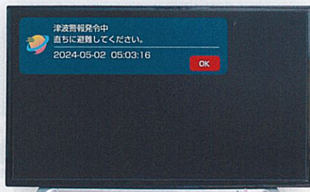
電源OFF時にもダイアログ表示

作業中でもテレビを見ていなくても通知を受け取れるようにHOTLINE TV Alertで知らせてくれます。