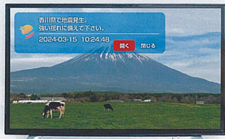
読み上げ機能・HOTLINE TV Alert

位置情報の登録に合わせて、メッセージの受信(防災や緊急情報の通知)が可能です。お住まいのエリアに応じたメッセージを受信できます。