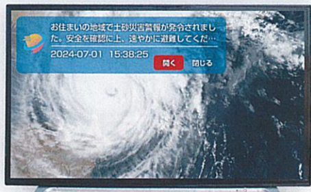
情報通知(災害用など)

位置情報の登録に合わせて、メッセージの受信(防災や緊急情報の通知)が可能です。お住まいのエリアに応じたメッセージを受信できます。