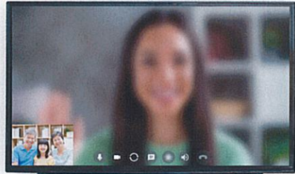
バーチャル背景(PC)・ボカシ機能