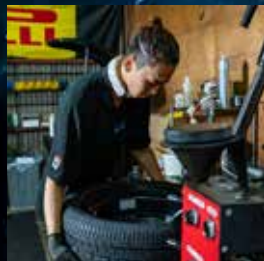
自動車整備 (ピット)