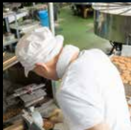
厨房作業・食品工場・薬品工場