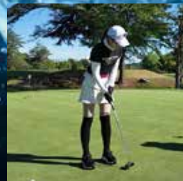
屋外イベント・ゴルフ