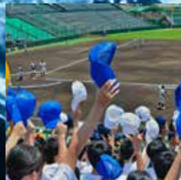
高校野球の選手・マネージャー・応援席