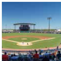
スポーツ・イベント会場